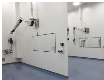
Production des utilités «grises» nécessaires au process d'une unité de production