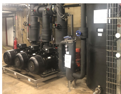
Installation et maintenance des groupes d'eau glacée et des équipements de traitement d'air